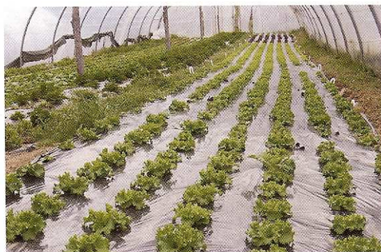
La SARL Les « Paniers de Martin » s'approvisionne auprès d'exploitations tournées vers l'agriculture biologique.